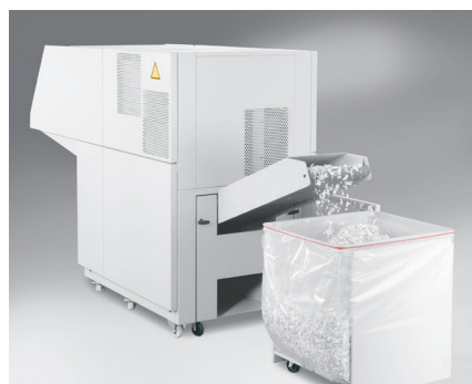
avec système d'évacuation des déchets en option