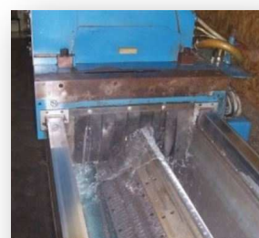
AFFÛTAGE DE LAMES