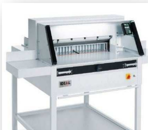
VENTE MASSICOT NEUF