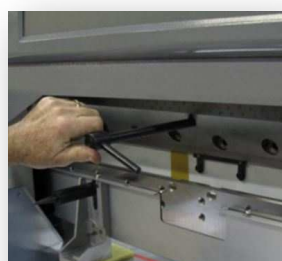
CHANGEMENT DE LAME