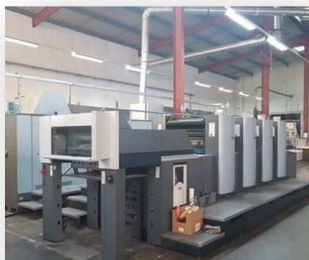
VENTE MATÉRIEL D'OCCASION