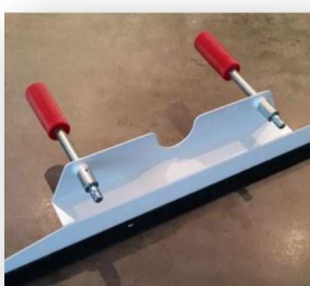
VENTE PIÈCES DÉTACHÉES